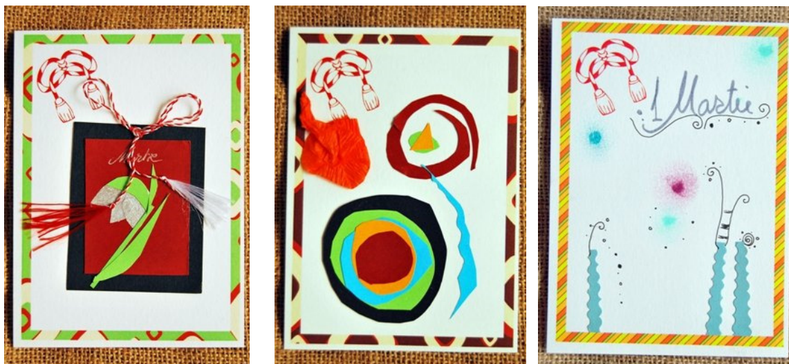
Felicitări realizate în cadrul atelierelor