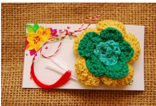
Mărțișoare realizate în cadrul atelierelor