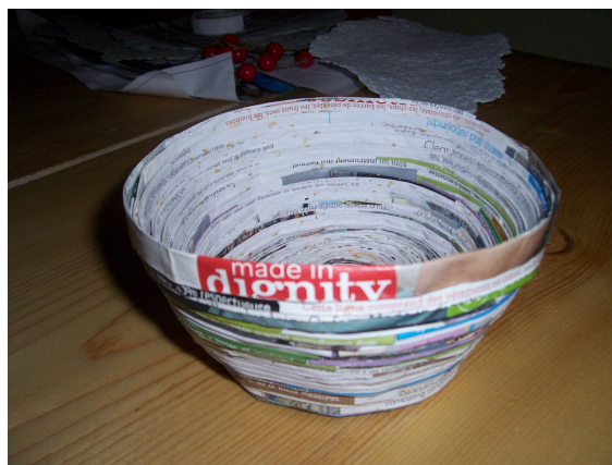
Broșă și recipient realizate din deșuri de hârtie în cadrul unui atelier de lucru manual