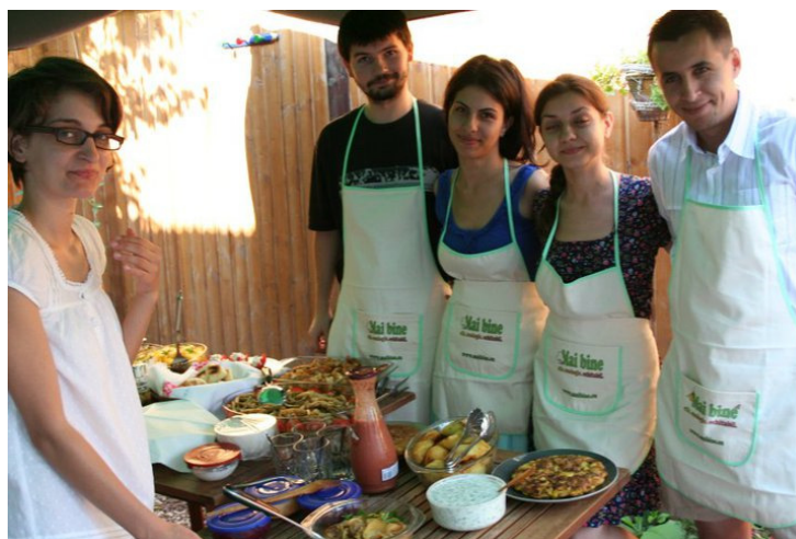
Afiș pentru promovarea primei ediții și fotografie cu voluntarii Mai Bine de la prima ediție