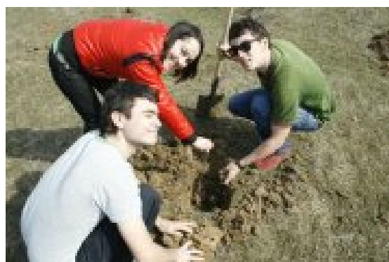
Fotografii sesiune plantare pueți, martie 2010